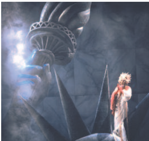
Light - Ballet of XXe century