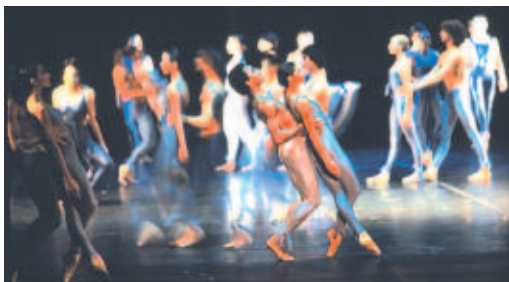
Caligula - National Theatre of Belgium - Foto D. Gaffé