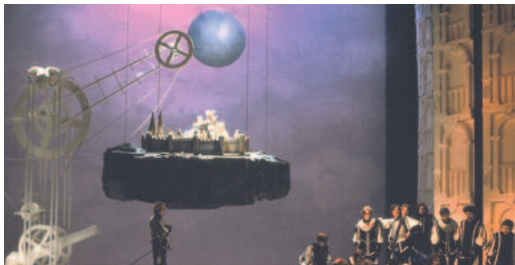
Cyrano de Bergerac - National Theatre of Belgium