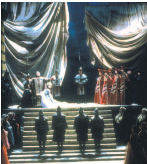
Bocca Negra - Royal Opera of Wallonie